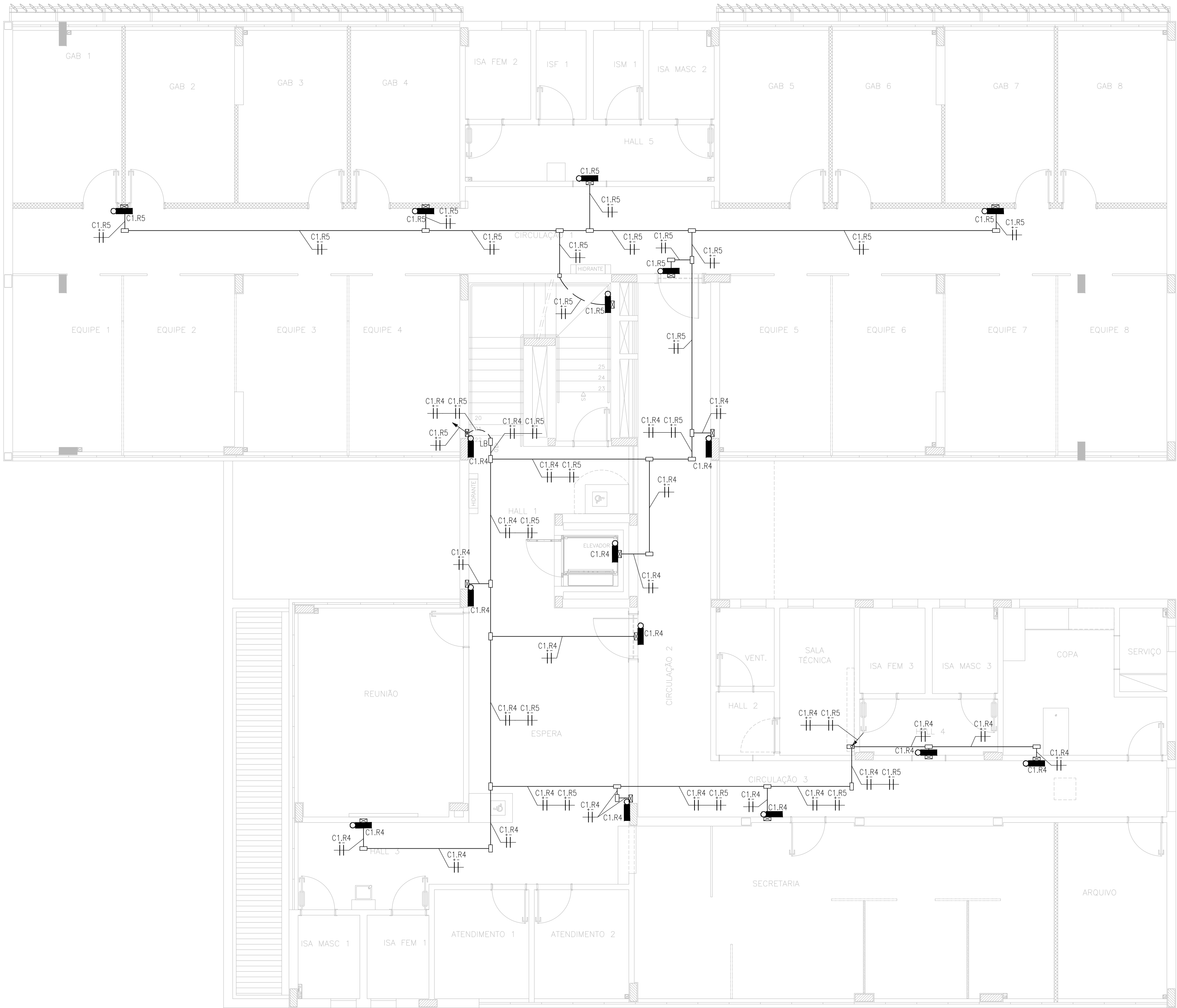
2° PAVIMENTO ESCALA 1/75